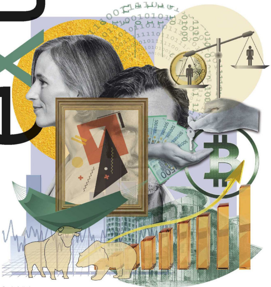
Illustration: Eva Vasari